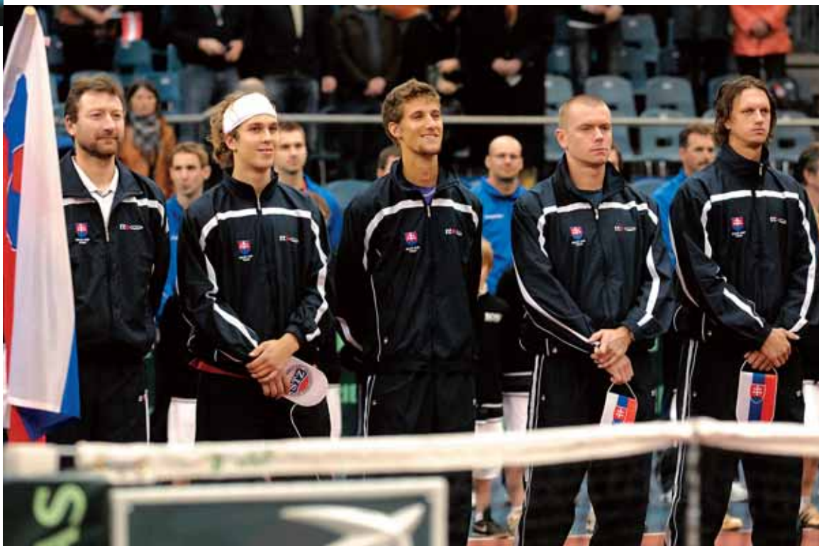
Takto nastúpil slovenský tím v Bad Gleichenbergu – zľava kapitán Miloslav MEČIŘ, Lukáš LACKO, Martin KLIŽAN, Michal MERTINIÁK, Filip POLÁŠEK